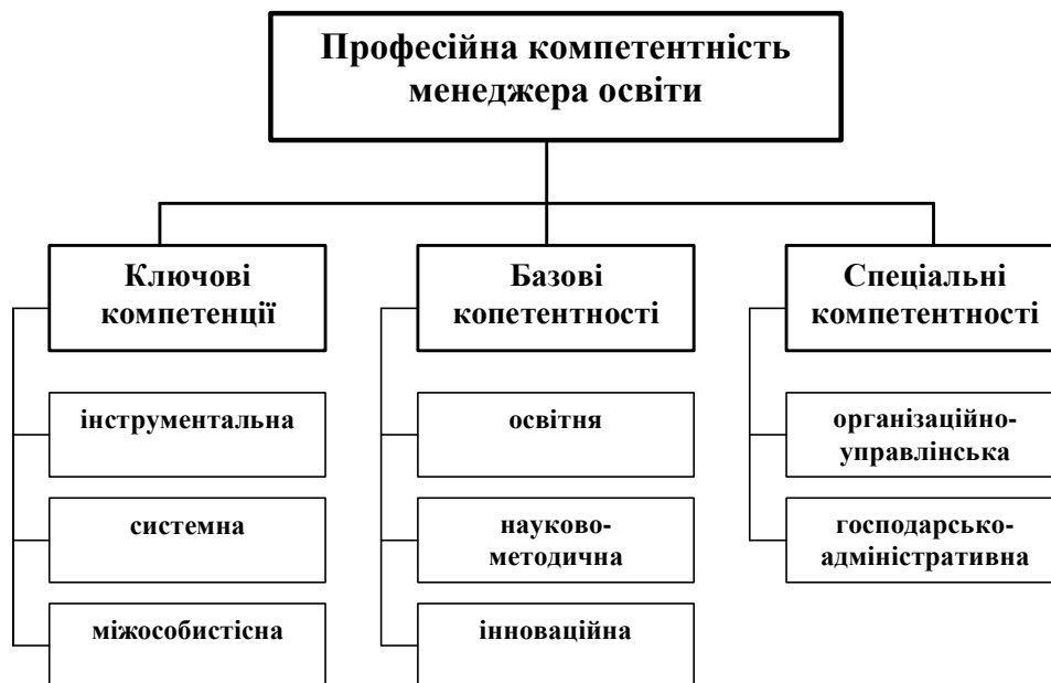
Рис.2. Компетентнісна модель менеджера освіти

У межах конкретної професійної діяльності фахівець має володіти так званими спеціальними компетентностями. Тому, спираючись на кваліфікаційну характеристику менеджера освіти спеціальності 8.000009 «Специфічні категорії. Управління навчальним закладом», визначену державним освітнім стандартом ВПО, ми визнали за необхідне виділити складник, який характеризує готовність фахівця у вузькій галузі професійної діяльності, тобто діяльності у сфері управління навчальним закладом, яка містить організаційно-управлінську та господарсько-адміністративну компетентності.